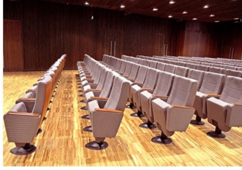
HALIC Nikah Salonu, İstanbul, TURKEY

Model: ASTRA | FW-BW; Koltuk Sayısı: 285 adet; Montaj Yılı: 2012