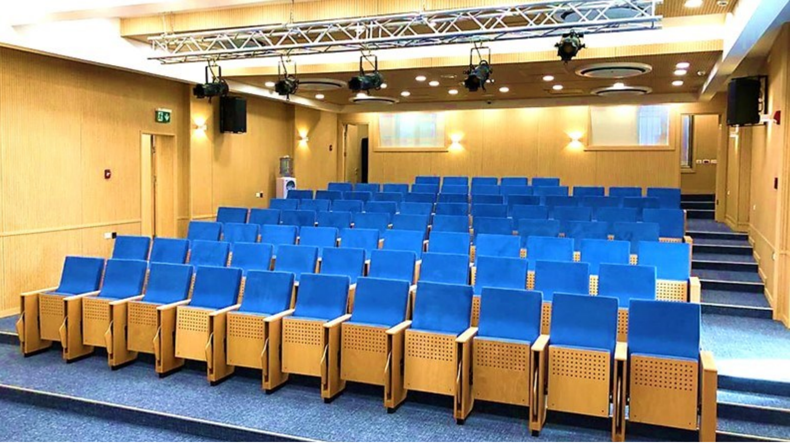
Filistin Bařbakanlık Binası Konferans Salonu, Ramallah Filistin Model: CELO-WT | W-BSW; Koltuk Sayısı: 88 adet; Montaj Yılı: 2019